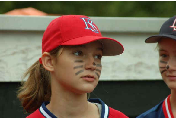
Das Schminken mit Eye-Black, um den Gegner zu beeindrucken, gehört natürlich auch dazu.

Darüber hinaus stärkt der Workshop in besonderer Weise das Selbstbewusstsein der teilnehmenden Mädchen. Mädchen und Jungen sind in dieser Phase und auf diesem Leistungsniveau noch gleichstark (im Unterschied beispielsweise zum Fußball, wo Dribbeltechnik, Schusskraft und Laufgeschwindigkeit viel deutlicher ins Gewicht fallen.)